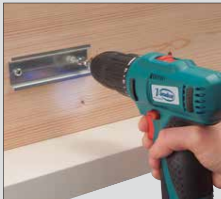
Compacte, puissante et permet une manipulation pratique.