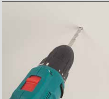
Rapide fixation de la mèche.