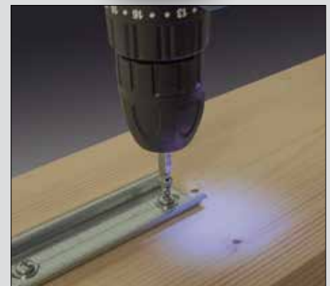
Lumière LED pour un éclairage optimal de la zone de travail.