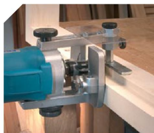
Feuillurage avec la fraise réf. 1240046 et les patins réf. 1250041 ou 1850042.