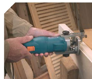
Réalisation de moulures.