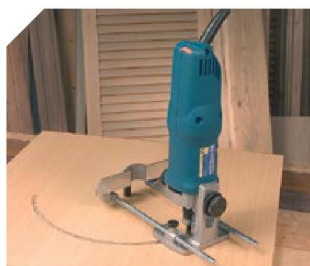
Rainurage circulaire avec compas (fourni).