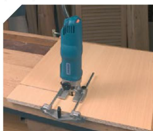
Rainurage avec équerre laterale.