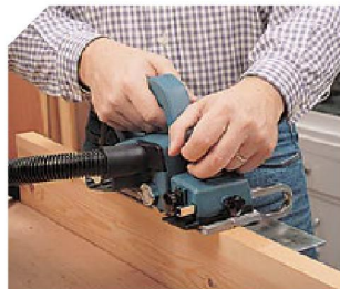
Idéal pour les travaux de chantiers.

Équipé de couteaux réversibles au carbure et d'une buse d'aspiration ainsi que d'un guide latéral.