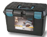
Coffret de transport