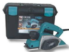
Coffret de transport.