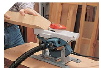
SoCLE pour l'utilisation du rabot en position stationnaire.